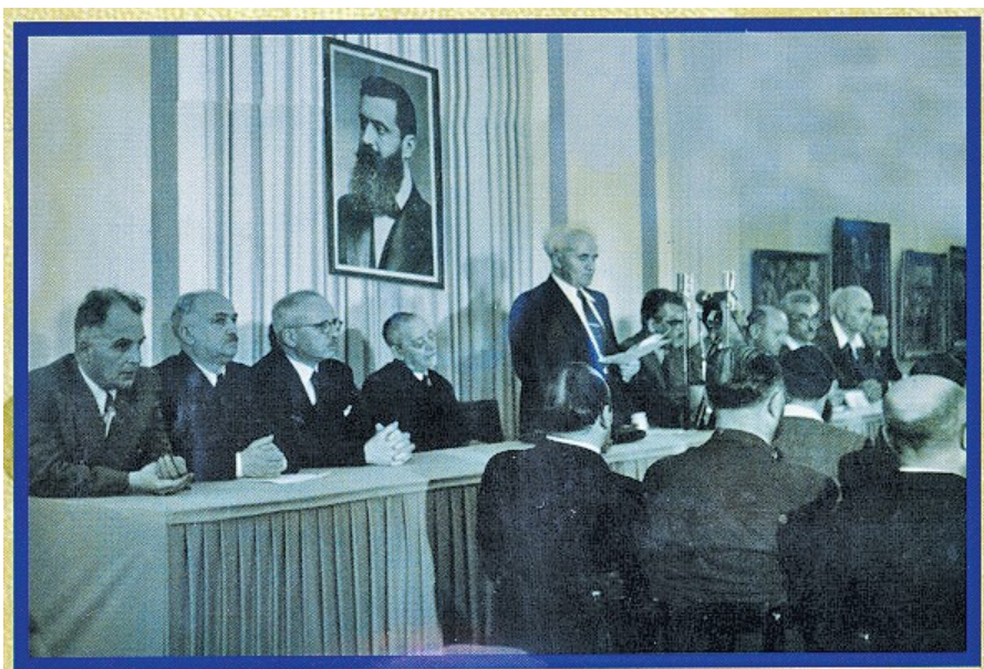
Tel Aviv 14. toukokuuta 1948 (5.Yar 5708) David Ben Gurion lukee Israelin valtion itsenäisyysjulistuksen

„Sillä HERRA armahtaa Jaakobia ja valitsee vielä Israelin ja tuo heidät lepoon omaan maahansa” (Jes 14:1).